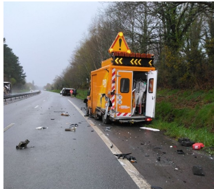
Accident du 29 mars 2024 à Baud